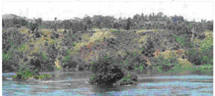
Het nieuwe land van Mto Moyoni aan de oever van de Nijl.....